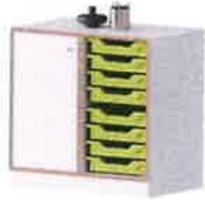
quickly® Schrank, 2 OH, 1 Tür links mit Schloss, 8 kleine Ergo Tray Boxen, B/H/T: 470,00 €