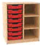
MATERIALUNTERREGAL MAM - 1X8 S - HÖHE 80 CM