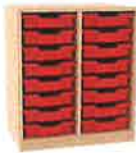
MATERIALUNTERREGAL MAM - 2X8 S - HÖHE 80 CM