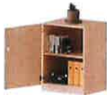
Schrank, 2 OH, 1 Tür, abschließbar, links, B/H/T 60x82x60cm 370,00 €